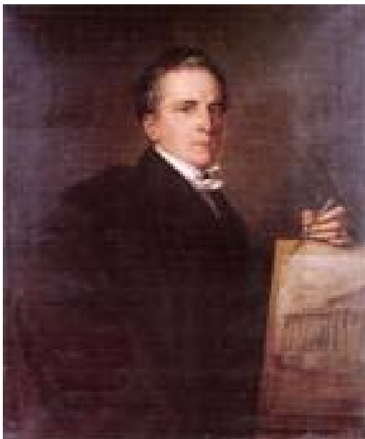
Than Mór festménye Pollack Mihályról