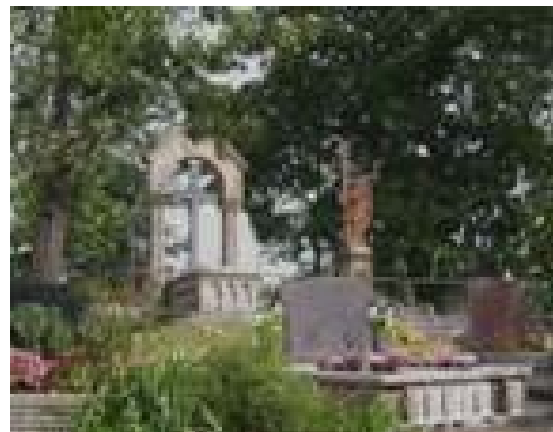
Tahitótfalú temetőjében síremléke