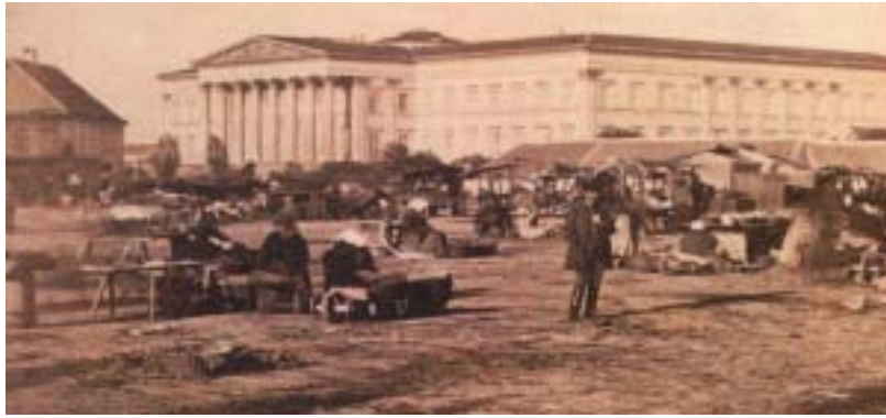
Nemzeti Múzeum – legfőbb műve